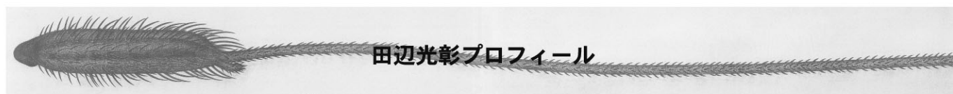
田辺光彰プロフィール

終らない挑戦を続ける彫刻家・田辺光彰。その作品は国際的な環境保全活動として国連が認めている。また、イサム・ノグチ氏と交流を続け愛弟子ともいえる。日本彫刻界に衝撃を与えた「さく」(1983)、「遙かなるもの・横浜」(1987)、「直江津」(1988) から、地球規模の自生地保全メッセージを掲げ、中国・タイ・インド・オーストラリア・アメリカ・キューバ・イタリア・北極と発表の場を広げた一連の「MOMI シリーズ」(1991～) など全作品を網羅。